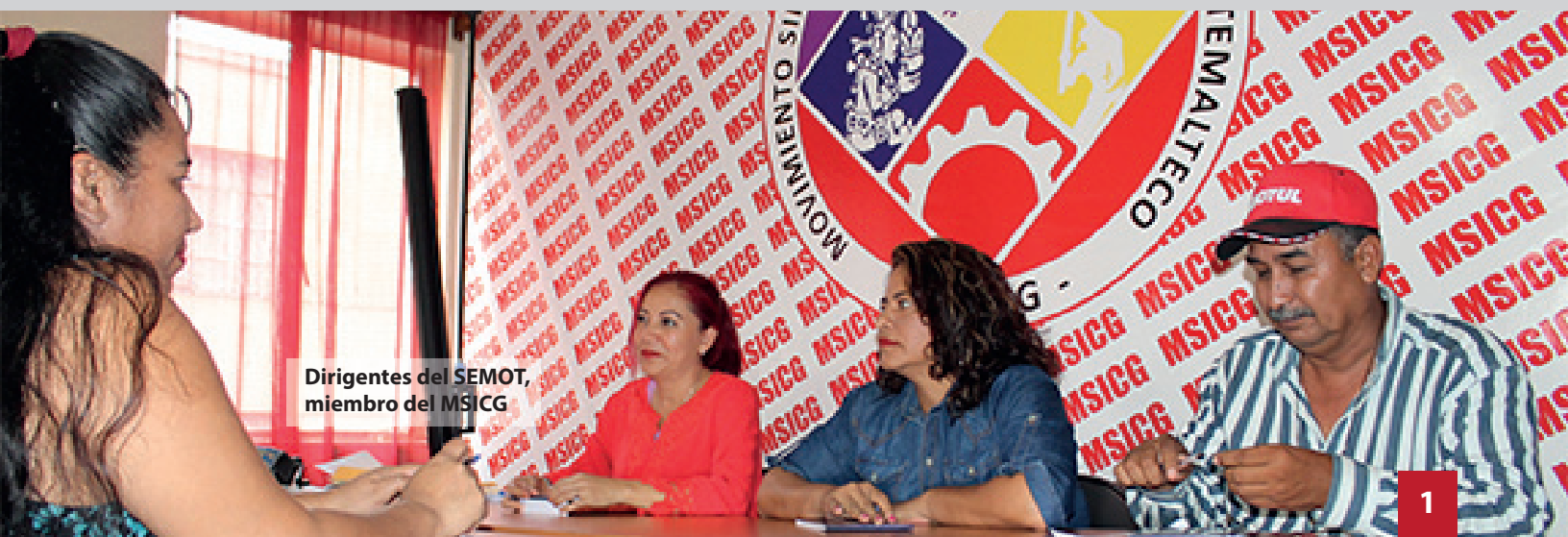
Dirigentes del SEMOT, miembro del MSICG

El derecho humano más importante después del derecho a la vida, es el de la libertad sindical porque a través de este se reivindica la dignidad humana.