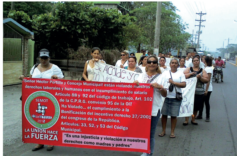
Movilización sindical SEMOT